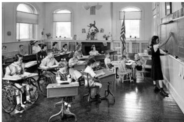
صف للأطفال من ذوي الإعاقات الجسدية (١٨٨٤)