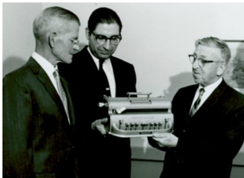
طابعة بيركنز برايل (١٩٥١)