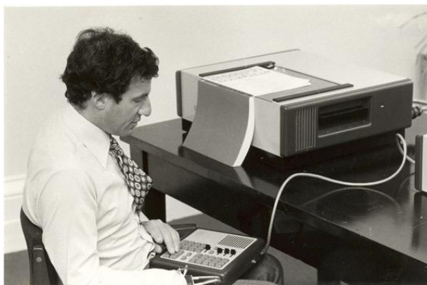
آلة قراءة كورزويل (١٩٧٦)