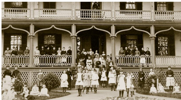
أول مدرسة مخصصة للصم (١٨١٧)